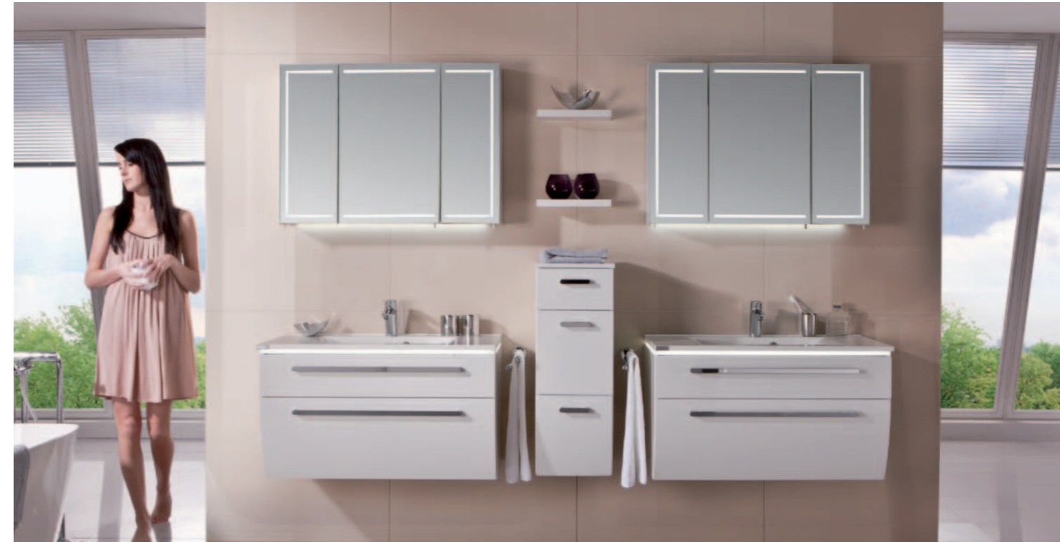
2 x Einzelkombination 906 mm breit, Front- / Korpusdekor: Polarweiß hgl. / Weiß hgl.