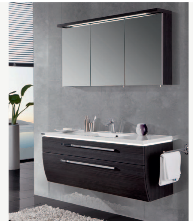
Einzelkombination 1206 mm breit, Front- / Korpusdekor: Hacienda Schwarz