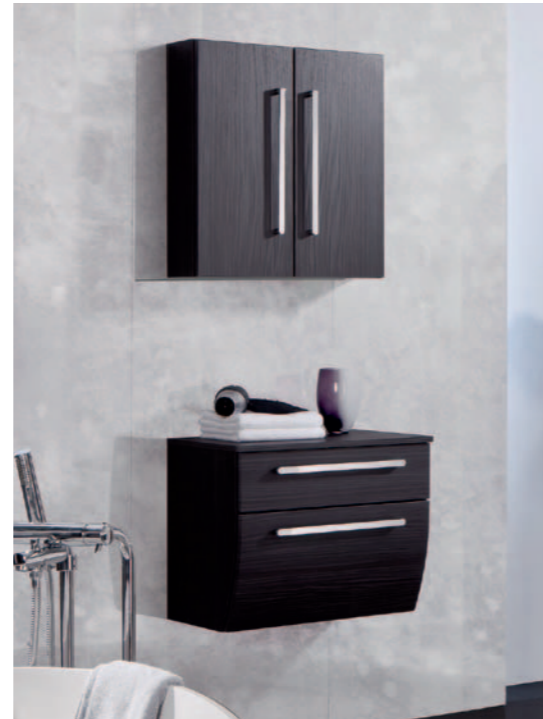
Vielfältiges Kombinieren mit Ergänzungsschränken.