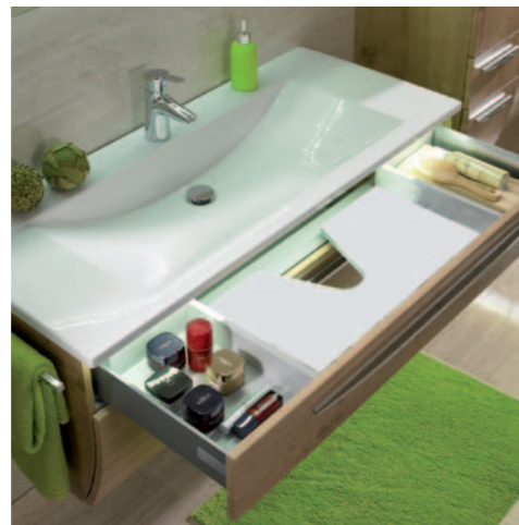
Für mehr Ordnung im Bad – Waschtischunterschranke mit zwei Fächern im oberen Schubkasten.