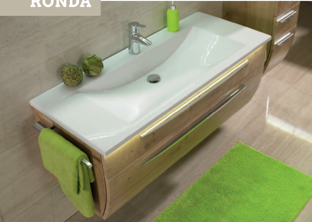
Die Waschtische aus Mineralguss, Acryl (Abb. oben) und Glas unterscheiden sich in ihrer fließenden Form vom Keramik-Waschtisch.