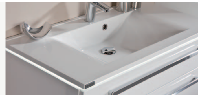
Ein absoluter Hingucker ist das LED-Beleuchtungsprofil zwischen dem Waschtisch und dem Waschtischunterschrank.