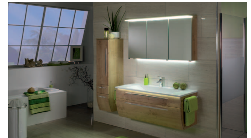
Leuchtende Eindrücke sorgen für Wohlfühl-Atmosphäre.